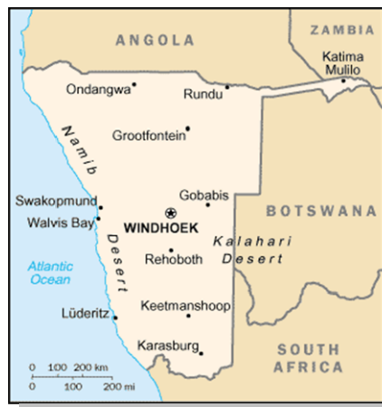
Plan géographique de la Namibie ; Otjivero se trouvant à environ 100km à l'est de Windhoek 8

La Namibie est un vaste pays peuplé par seulement deux millions de personnes, possédant une frontière avec l'Angola, la Zambie, le Zimbabwe, le Botswana et l'Afrique du Sud.